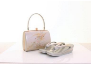
友禪柄合皮礼装用草履バッグセット