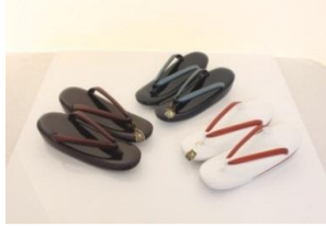
キンワシ印 天皮草履 (メ)6,800円の品 3,570円