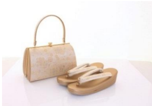
佐賀錦礼装用草履バッグセット