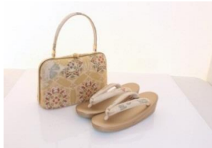
高級帯地礼装用草履バッグセット