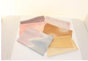
正絹 帯揚 (メ)6,090円の品 1,570円