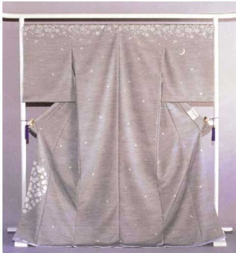
樋口隆司オリジナル作品 紬ちりめん訪問着「雪月花」