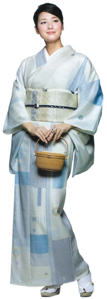
樋口隆司オリジナル作品 絹縮緬「祝祭」 (美しいきもの2013冬号掲載)