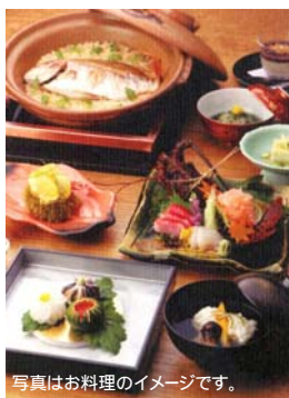
写真はお料理のイメージです。