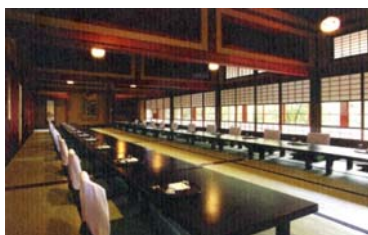
大広間では長時間おくつろぎいただける様に、椅子席とさせていただきます。

江戸時代中期に創業以来、三百年の歴史を誇り、県の文化財にも指定されている名亭葉山日影茶屋。多くの文豪たちの所縁の茶屋として永きに渡り湘南の移ろいを見守ってきました。手入れの行き届いた庭園は四季折々の美しさを映し、自慢の料理は相模湾の取れたての魚介を中心に地産産の野菜を使い、関東屈指の料亭会席として高い評価を受けています。由緒ある大広間で極上の新春の味覚を心ゆくまでご堪能ください。